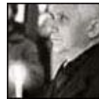
Protesta contra el internamiento de prisioneros políticos en Polonia