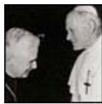
Cardenal Ratzinger con el Papa Juan Pablo II