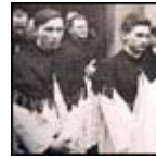
Ordenación Sacerdotal de Benedicto XVI