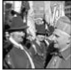
Benedicto XVI junto a unos montañeros bávaros en Munich, el 28 Febrero de 1982