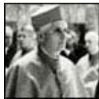
Benedicto XVI (centro) en el Cónclave de 1978, del cual salió elegido Pontífice Juan Pablo II