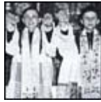
Benedicto XVI y su hermano Georg son ordenados sacerdotes en la catedral de Freising