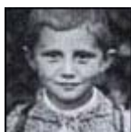
Benedicto XVI de niño