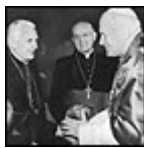
Cardenal Ratzinger con el Papa Juan Pablo II