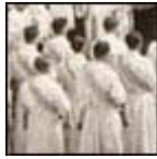
Su Ordenación sacerdotal en la catedral de Freising, el 29 de junio de 1951