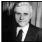
Profesor en Regensburg