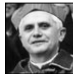
Benedicto XVI cuando era Cardenal