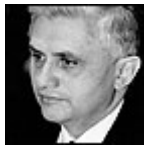
Arzobispo de Munich y Freising