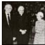
Benedicto XVI con sus hermanos Georg y María en una feria en Munich