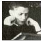
En 1955, realizando una lectura en Freising, sobre Teología dogmática y fundamental