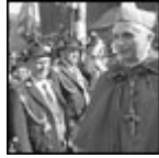
Benedicto XVI junto a unos montañeros bávaros en Munich, el 28 Febrero de 1982