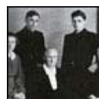
Benedicto XVI el día de su ordenación. A la izquierda su hermano Georg, junto a su