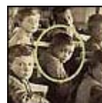
Benedicto XVI, en el colegio