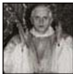
Misa en Jerusalén