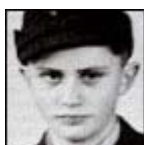
En 1943, utilizando el uniforme de la unidad militar de defensa antiaérea