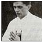
Celebrando Misa en una montaña cerca de Bavaria en 1952