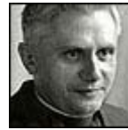
Profesor en Regensburg, 1965