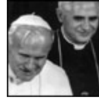
Cardenal Ratzinger con el Papa Juan Pablo II