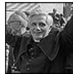
Es nombrado Arzobispo de Munich y Freising en marzo de 1977