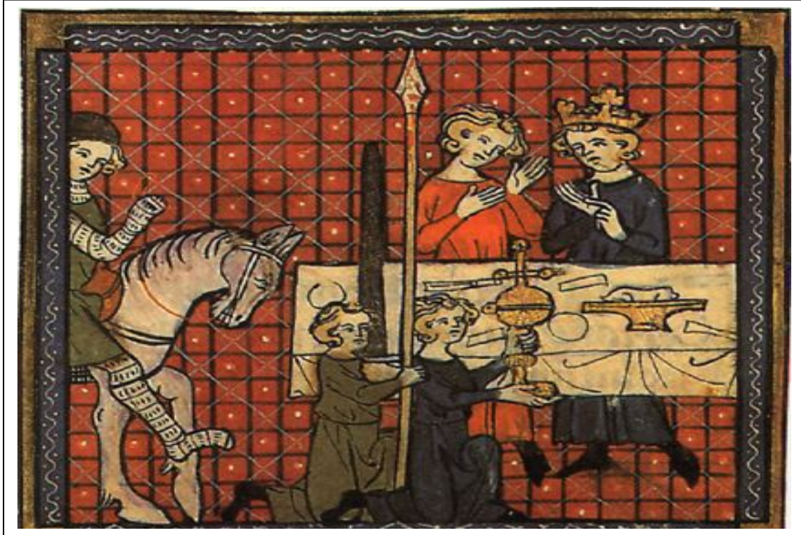
Grabado del manuscrito de París 12577, Le Conte du Graal , Chrétien de Troyes.

( Perceval o Peredur) que reclamaba venganza. Algunos críticos como J.Marx dicen que la trama estaría más próxima del prototipo céltico. Mientras que Chrétien de Troyes , un siglo antes , prefiere dar un nuevo sentido a la aventura caballeresca, dejando aparte la leyenda de la venganza familiar y prefiriendo una queste espiritual.