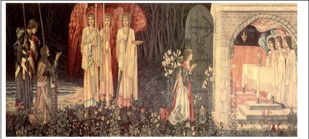
"The Achievement of the Grail" (1891-4) Tapestry by Edward Burne-Jones, Museum and Art Gallery of Birmingham

Desde hace tiempo , se observa un resurgir del mito artúrico en nuestra sociedad a través de diferentes medios de comunicación. El cine se apoderó de las leyendas en varias ocasiones, y no es sorprendente ver cómo cada fin de año una miniserie o una película dedicada al famoso Arturo o a las leyendas de Merlín y de Ávalon. Un mito adaptado, mayoritariamente, por los publicistas que se inspiran en la materia de Bretaña para crear un mundo maravilloso donde existían unos valores como el honor , la solidaridad entre caballeros , la templanza , la fortaleza , la lealtad etc ....Tantas cualidades perdidas por el ser humano del siglo XXI, perdido en una sociedad en la que esos valores fueron reemplazados por la avaricia , el egoísmo, la ansia de “medrar” en la jerarquía social o simplemente por el instinto de supervivencia cuando el dinero falta. Claro que lo que acabo de enumerar son caricaturas de la sociedad contemporánea. Pero no todo es erróneo, y por eso el hecho de viajar hacia Otro mundo , otra época, puede parecer inútil en un principio hasta que uno comprenda que las leyendas y los mitos son necesarios para entender lo que nos falta hoy en día : un poco de ilusión en un mundo demasiado racionalizado y científico. Notamos que aquellas leyendas no están simplemente dirigidas a los niños, sería un error pensarlo. Al contrario la materia de Bretaña encierra en sí misma numerosas lecciones o escarmientos para el adulto.