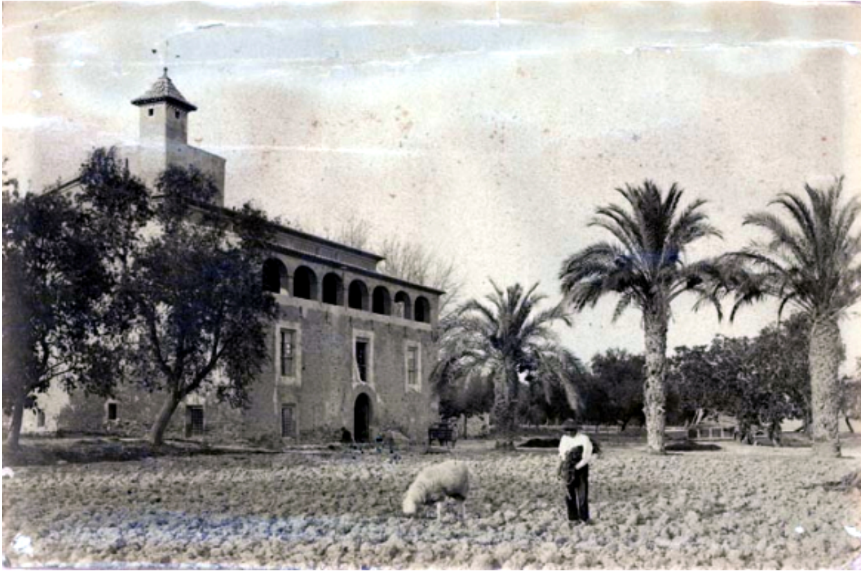
Fig. 3: Foto antigua de La Barbera dels Aragonés.