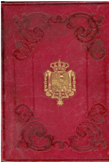
Fig. 5: Portada Real Depacho de 1862 de la Familia Aragones.

El resultado, desde nuestro punto de vista, ha sido muy positivo ya que un importante núcleo de personas, que nos han atendido e informado, continúan prestándose a colaborar en la tarea que tiene encomendada este Museo Municipal.