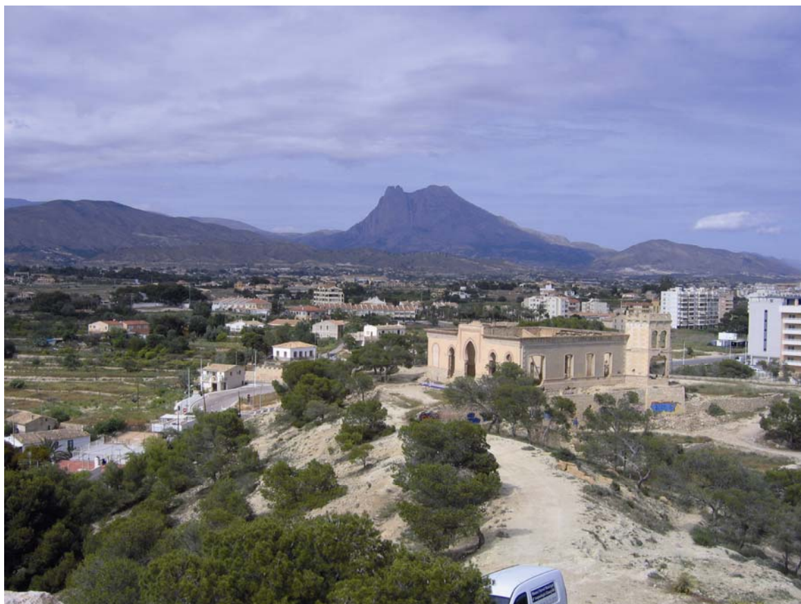
Fig. 2: Panorámica del interior de La Vila Joiosa con el Puig Campana al fondo.