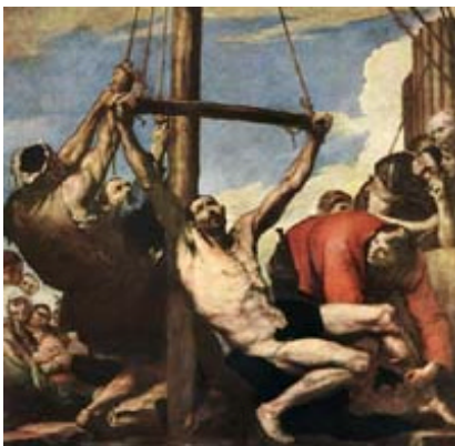
Ribera, Martirio de San Felipe , 1639, conocido como San Bartolomé, Museo del Prado, Madrid.

“(…)José de Ribera, known as 'Lo Spagnoletto', was born in Játiva (Valencia, Spain) although he went to Italy before 20. Not much is know from his life in Spain, he is supposed to have studied in Valencia with Francisco Ribalta. In 1616 he settled down in Naples where he developed all his career and became the leading painter in his period.