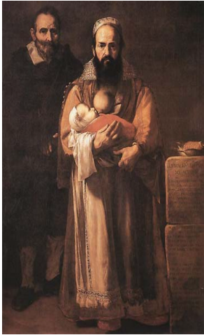
Mujer Barbuda Ribera