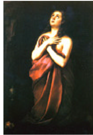
Magdalena Penitente Murillo