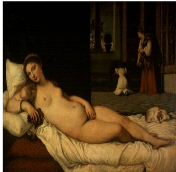
Bridgeman Art Library, London/New York

ENCICLOPEDIA ENCARTA© 1993-2003 Microsoft Corporation. Reservados todos los derechos.