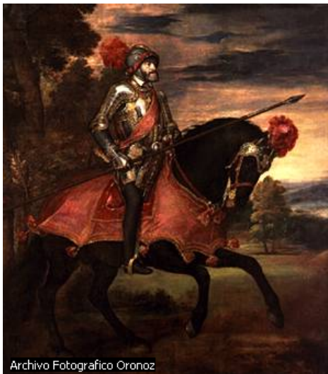
“El emperador Carlos V (Carlos I de España) encabezó a las tropas imperiales el 24 de abril de 1547 en la decisiva batalla de Mühlberg, que tuvo lugar a orillas del río Elba y que supuso su hegemonía política y religiosa sobre Alemania. Esta famosa pintura de 1548, realizada por Tiziano y conservada en el Museo del Prado de Madrid, representa al emperador sobre su caballo durante la batalla. Archivo Fotográfico Oronoz”.

ENCICLOPEDIA ENCARTA© 1993-2003 Microsoft Corporation. Reservados todos los derechos.