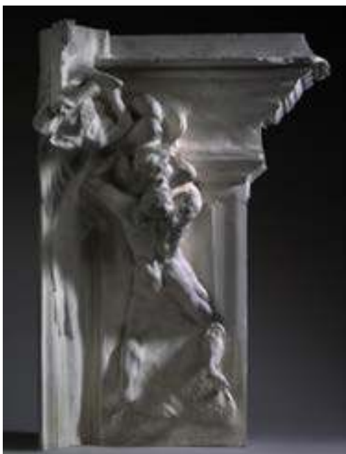
Elemento de La puerta del Infierno con Soy Bella, c. 1888-1889

Las figuras y los grupos creados para la Puerta pasan por una fase de adaptación para poder colocarlas en el conjunto. El escultor tiene que modificar sus bases, cortar algunas partes o cambiar la posición de algunos miembros, para conectar sus creaciones con el fondo o el marco de la puerta. Para ello también renueva el tratamiento de ciertos elementos del vocabulario decorativo tradicional, como las hojas de acanto y los follajes.