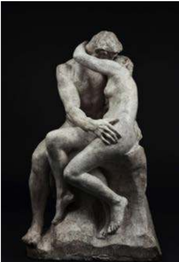
El beso , 1881-1882

Muchos dibujos y varias esculturas representan escenas que pueden relacionarse directamente con ciertos pasajes del Infierno , pero el artista nunca ilustra literalmente el texto de Dante . La relación es más sutil, a veces tenue, y a menudo son sus anotaciones en las obras las que nos permiten establecer la conexión. Los temas principales son los pecados y sus distintos castigos , y en general los sufrimientos que se causan a sí mismos los seres humanos debido a sus defectos, pero también a sus sentimientos .