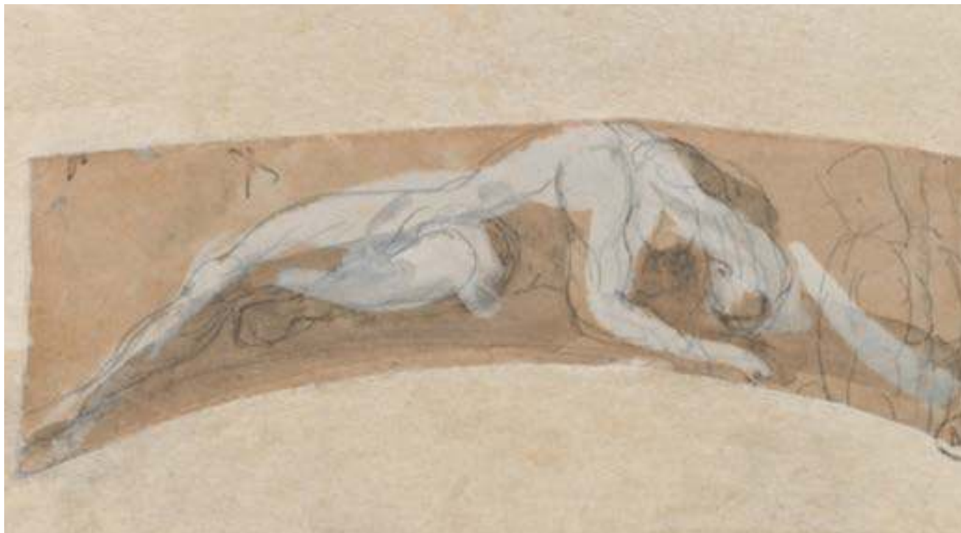
Sombra sobre una roca, c. 1880