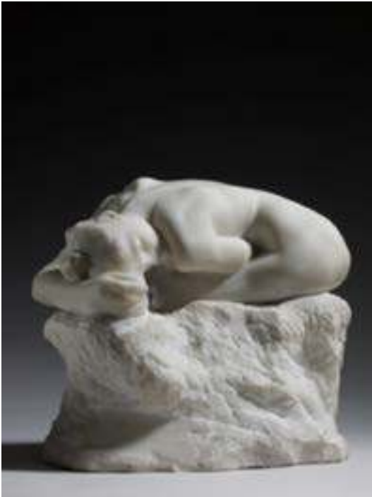
Andrómeda, c. 1882-1885