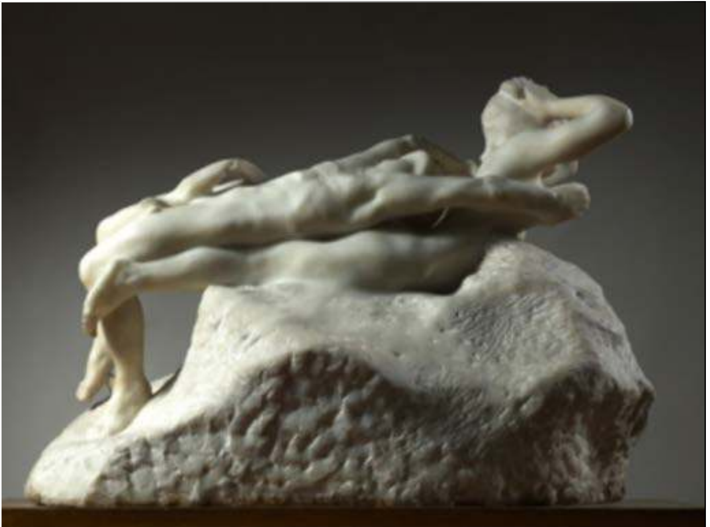
Fugit Amor , antes de 1887

Durante el periodo de intensa actividad creativa iniciado en 1880, Rodin creó un amplio repertorio de varios cientos de formas . El escultor no las incluyó todas en La puerta del Infierno , o no lo hizo inmediatamente, pero desde entonces y hasta el fin de su actividad reutilizó figuras, grupos y fragmentos para sus creaciones posteriores. Los primeros ejemplos fueron simplemente aislados y realzados colocándolos sobre una base (pedestal, roca, zócalo...) para poder exponerlos, en yeso o traducidos en otro material como el bronce o el mármol. A otros se les ensambló algún elemento (cabeza, brazo, pierna, figura entera, etc.) para crear una obra nueva ; y otros, desde finales de la década de 1890, se aumentaron o redujeron , enteros o fragmentados, modificando así profundamente su presencia ante el espectador, hasta el punto de que en estos casos se deben considerar como versiones completamente nuevas de obras antiguas.