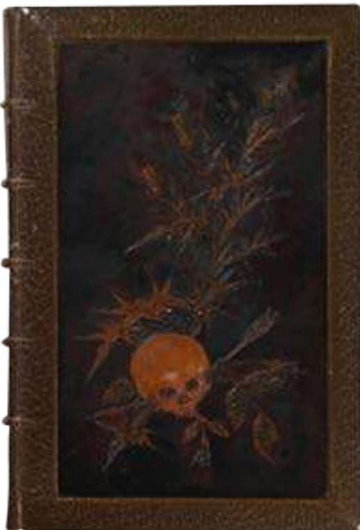
Ejemplar de la edición original de Las flores del mal, adornado con dibujos por Rodin, 1887-1888