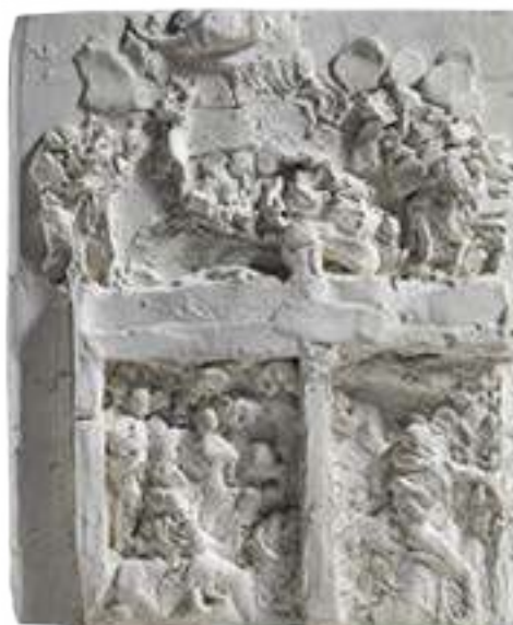
Segunda maqueta de La puerta del Infierno , 1880