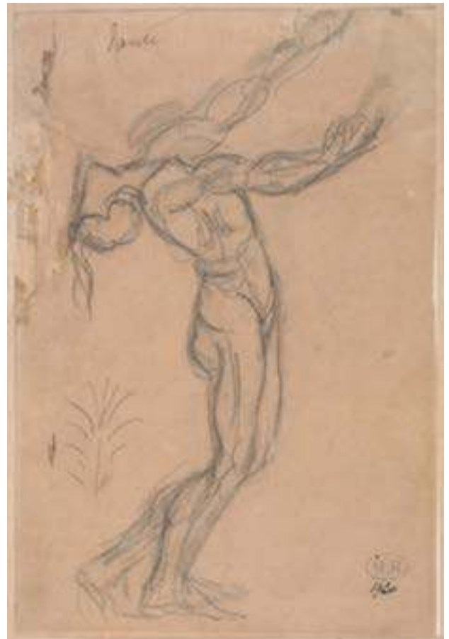
Dante cayendo de espaldas (anverso) , c. 1880