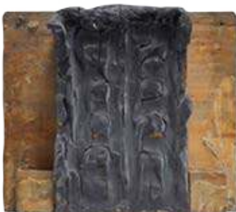
Primera maqueta de La puerta del Infierno , 1880