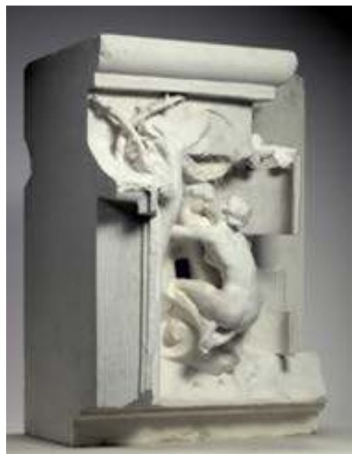
Las Metamorfosis de Ovidio,