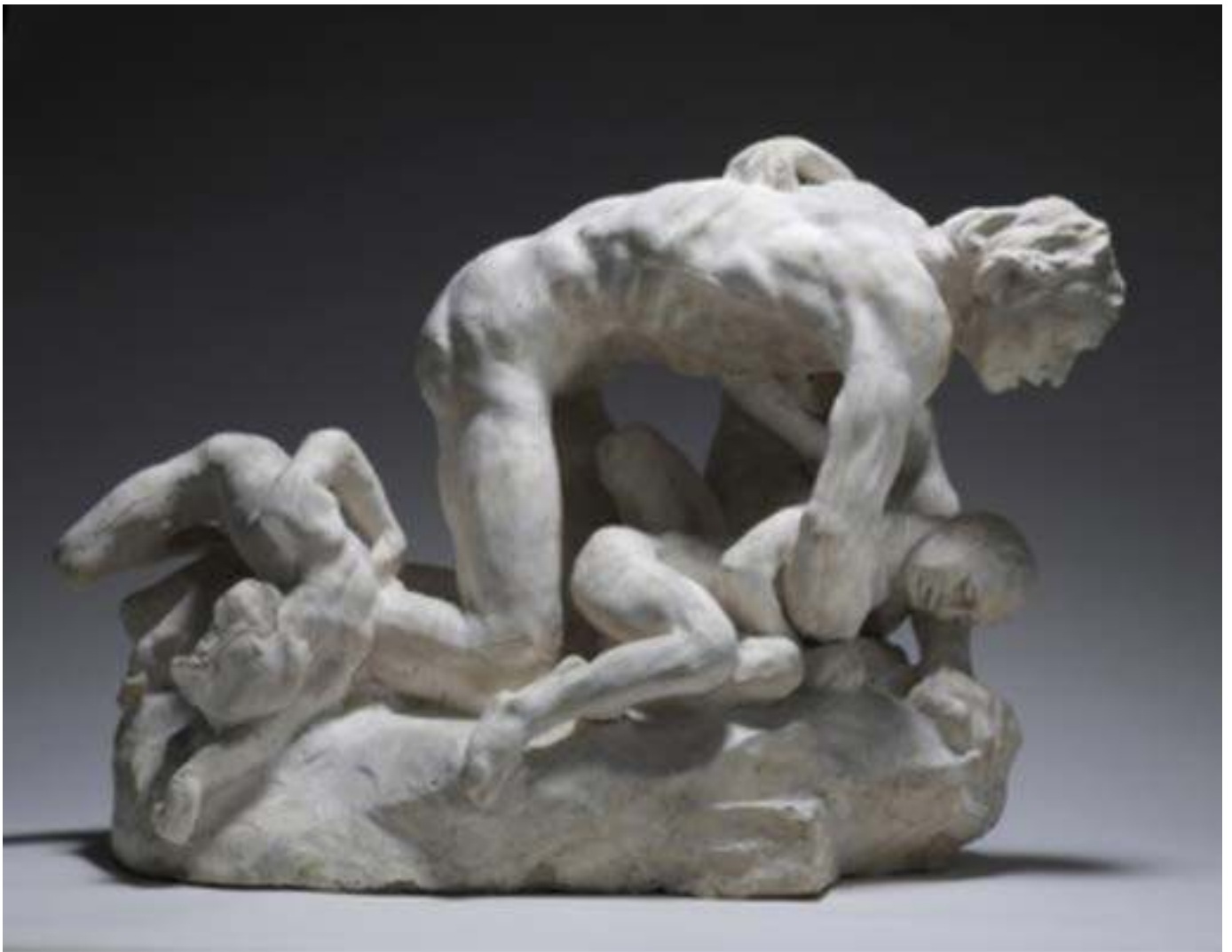
Ugolino y sus hijos, 1881-1882

Guiado por el poeta latino Virgilio, quiere encontrarse en el Paraíso con su amada Beatriz. Rodin se da a la tarea con frenesí, tratando de plasmar sus ideas con el dibujo y el modelado . Medita la composición global de su obra y al principio imagina una puerta formada por cuarterones yuxtapuestos con paneles esculpidos en bajorrelieve, como muestran las dos primeras maquetas modeladas y varios grandes dibujos de conjunto.