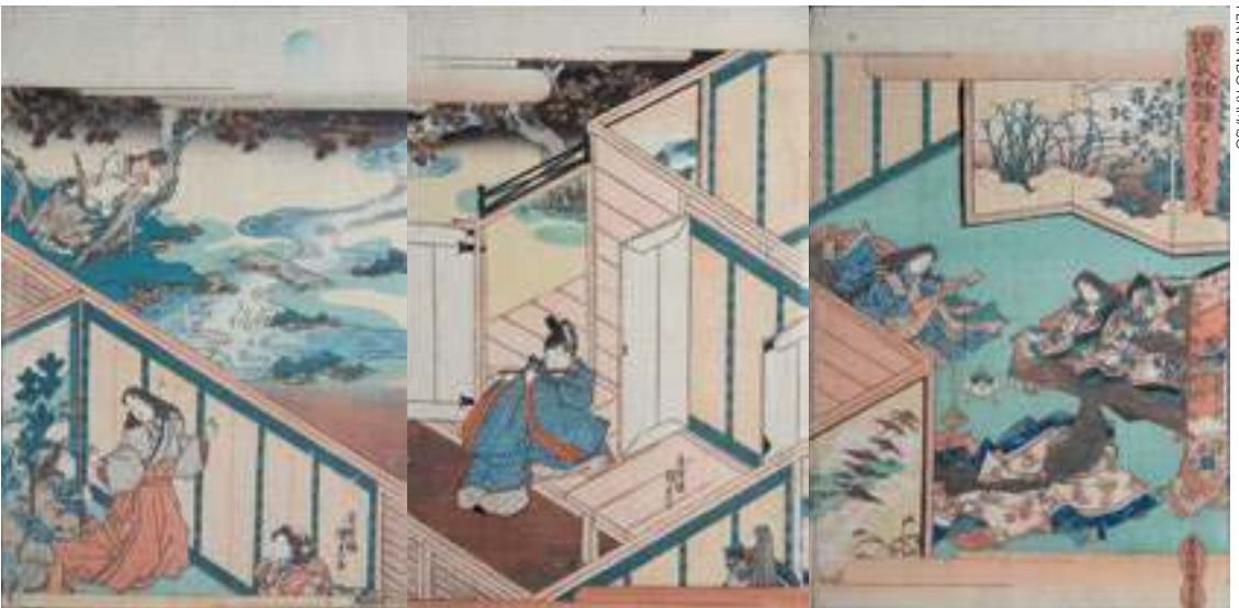
Utagawa Kunisada (Toyokuni III). Tríptico inspirado en la novela Genji Monogatari [La historia de Genji] de Murasaki Shikibu, 1830. Colección Bujalance