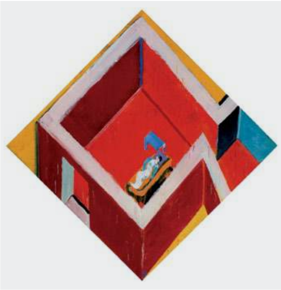
Juan Navarro Baldeweg. Habitación roja con figura , 2005. Colección Fundación Botín, Santander