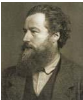
William Morris, 1870. Fotografía de Emery Walker reproducida en el frontispicio de The Collected Works of William Morris . Londres: Longmans, Green & Co., 1910-15. Victoria and Albert Museum, Londres

La presente muestra es más que una mera presentación de artes decorativas –a las que Morris redimió de su estatus de "artes menores"– y apunta desde su concepción a la absoluta pertinencia que tienen hoy la obra y las ideas de Morris, a quien Nikolaus Pevsner ya definió en los años treinta del siglo pasado como uno de los "pioneros del diseño moderno". Ese énfasis quiere hacer evidente la vigencia de sus ideas acerca del placer y la alienación en el trabajo, la desigualdad social o la protección del patrimonio y el medio ambiente, pues el tiempo de William Morris no es el pasado: es también el nuestro.