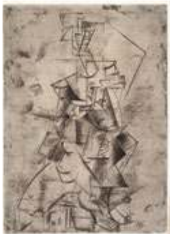
Pablo Picasso, Mademoiselle Léonie dans une chaise longue [La señorita Léonie en una chaise longue], 1910. Colección Fundación Juan March, Madrid

Pablo Picasso (Málaga, 1881-Mougins, 1973) concedió siempre gran importancia al grabado: de 1899 a 1972 realizó más de dos mil, y constituyen casi un diario de su vida de artista. En este gabinete se exhiben, de forma rotatoria, los fondos de la obra gráfica sobre papel de Picasso pertenecientes a la colección en depósito en el Museo Fundación Juan March. Se presenta en esta