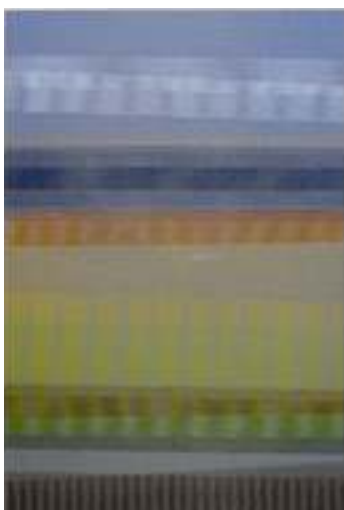
Arriba: Sin título, carpeta Transparencia del tiempo , 1977. Colección Fundación Juan March, Madrid. Abajo: Sin título, 1976. Colección Fundación Juan March, Madrid