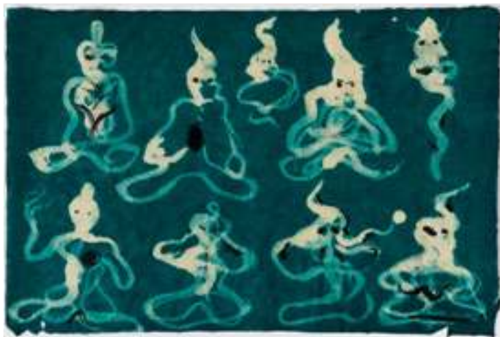
Miquel Barceló. Concert lamaïque [Concierto de lamas], 2010. Colección del artista