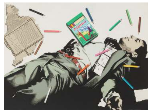
Equipo Crónica. Serie negra 5, 1972 © Vegap

Una muestra que parte de los orígenes del arte contemporáneo en España a principios de siglo, con Picasso, Miró y Dalí, para recorrer el realismo, la abstracción, el Pop Art y el arte de las últimas décadas del siglo XX y primeras del XXI, con artistas como Miquel Barceló, Luis Gordillo o Jaume Plensa.