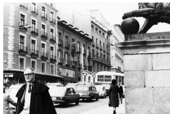
José Luis Sampedro. Madrid, 1962

En Un mundo en el desván de José Luis Sampedro nos adentramos, gracias a material inédito de su propio archivo personal, en el taller literario de José Luis Sampedro, en su forma de escribir, en sus esbozos, documentaciones, tablas, fichas, borradores, primeras versiones, en su diálogo permanente con su tiempo y con los lectores de ayer, de hoy y de mañana.