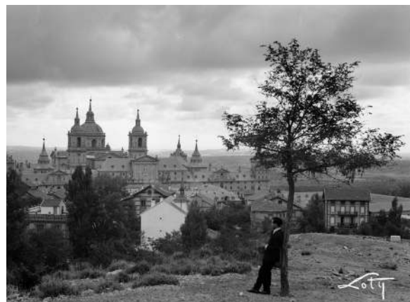
San Lorenzo de El Escorial. Foto: Loty (Antonio Passaporte). Instituto del Patrimonio Cultural de España. MECSE