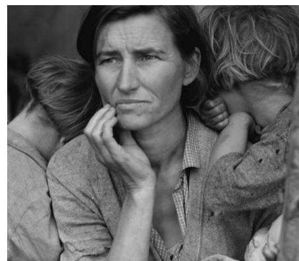
Dorothea. Migrant Mother. California, 1936