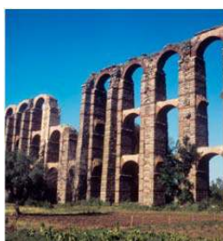
Acueducto romano de Los Milagros (Mérida). 1976