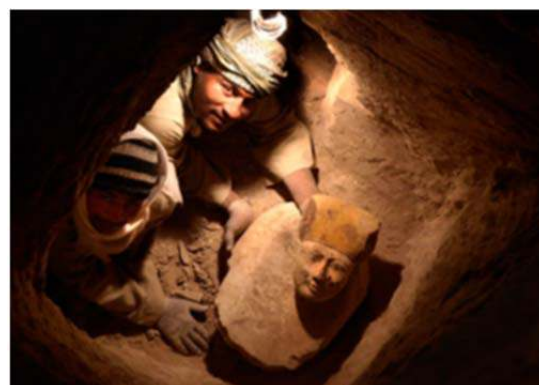
Tumba de Hery, Djehuty (Luxor, Egipto). 2012

EXCAVANDO EN EGIPTO , plasma la presencia de los arqueólogos españoles en Egipto se remonta a la colaboración de nuestro país en la campaña de la UNESCO, iniciada en 1960, para salvaguardar los restos arqueológicos egipcios y nubios que iban a ser destruidos con la creación de la presa de Asuán. Desde entonces, los esfuerzos de nuestros egiptólogos se han concentrado en varios yacimientos y, singularmente, en Herakleopolis Magna, en Ihnasya el-Medina, junto al lago Fayum, y más recientemente en la tumba de Djehuty, en la necrópolis de Tebas.