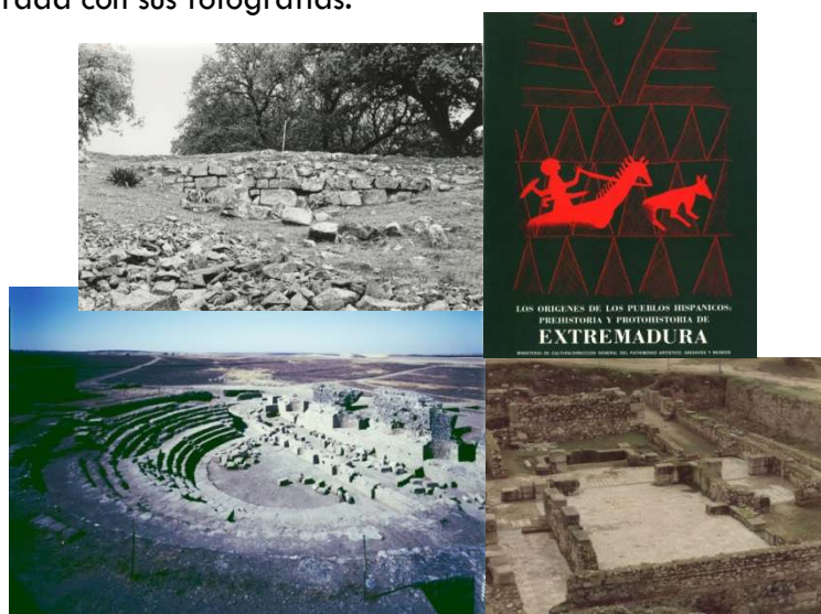
Fig. 1. Vista de la muralla de Nertobriga (Fregenal de la Sierra, Badajoz). Fig. 2. El teatro romano de Regina (Casas de Reina, Badajoz). Fig. 3. Portada del catálogo de la Exposición Prehistoria y Protohistoria de Extremadura . Fig. 4. La domus de la Alcazaba de Mérida.

Por ello, no es de extrañar que las muestras retrospectivas de las intervenciones realizadas por la Dirección General de Bellas Artes en los yacimientos de la Provincia de Badajoz (Bellas Artes-83), en coincidencia con otras a nivel nacional, fuera mayoritariamente ilustrada con sus fotografías.