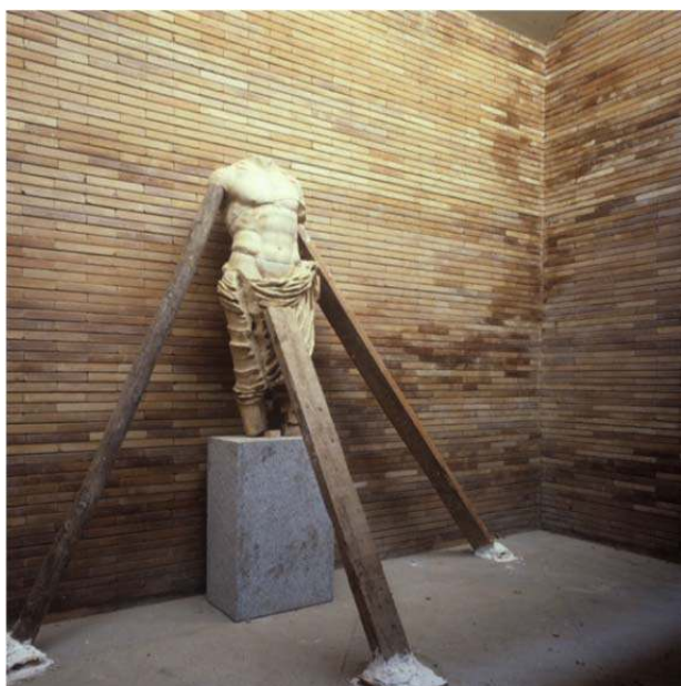
Proceso de montaje de una escultura romana en el Museo Nacional de Arte Romano de Mérida. 1986