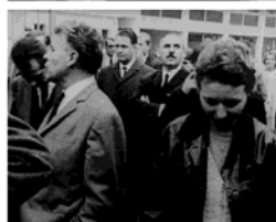
GRUPO MEDVEDKIN DE BESANÇON Classe de lutte . Película, 1968