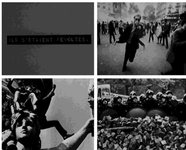
ANÓNIMO Cinétracts. Película, 1968

mostrará por un lado los cinétracts (literalmente cinepanfletos) que son breves cortometrajes rodados de forma anónima por una serie de directores profesionales – entre los que se encontraban Jean-Luc Godard, Alain Resnais o Chris Marker, a quien se debe la iniciativa– y de cineastas amateurs, que constituyen el equivalente, en