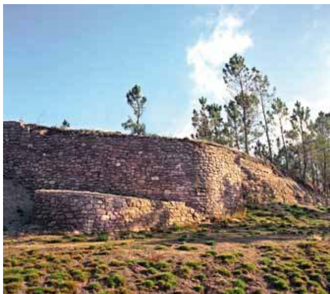
MURALLA. CASTRO COTO DO MOSTEIRO

novas, cunha gran variedade de técnicas e motivos. As vasillas están representadas por olas de pequeno, mediano e gran tamaño, destinadas ao uso doméstico, predominando as formas globulares e as de perfil en «S», cos bordos en aresta e exvasados característicos do interior. Xunto á decoración incisa e impresa, destaca a introdución da estampada con diversas matrices para realizar distintos motivos, predominando os curvilíneos, circulares ou en ángulo. Os curvilíneos están representados con eses simples, dobres, de tres ou catro trazos formando frisos, ou eses compostos que orixinan singulares motivos figurativos como os ornitomorfos ou parrulos. Os círculos poden ser sinxelos, concéntricos ou semicírculos formando composicións de arcadas ou de grilandas. E os triángulos represéntanse recheos de liñas ou lisos, combinados con varios círculos dispostos en liña ou nos vértices a modo de medallóns. Os motivos decorativos dispóñense, na súa maioría en franxas horizontais, delimitados por liñas incisas ou acanaladuras, e sitúanse nas ombreiras, ao longo da barriga, chegando ata a base e tamén no bordo e colo –Castromao, Mosteiro–. Neste momento dáse a presenza das distintas áreas das olarías definidas polas súas facturas, formas e estilos decorativos, orixinando novas tipoloxías –Cameixa, Castromao, A Forca, Mosteiro–, e marcando as diferenzas rexionais ou locais na cunca do Miño e nas Rías Baixas, como noutras manifestacións da cultura castrexa.