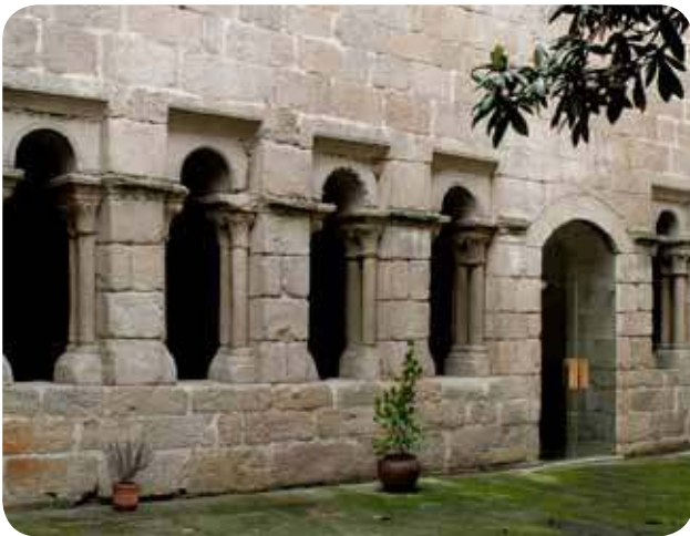
CLAUSTRO DO PATIO DO MUSEO ARQUEOLÓXICO NA SÚA SEDE DA PRAZA MAIOR