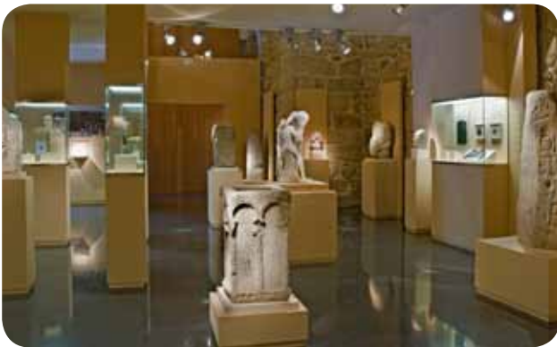
INTERIOR DA SALA DE ESCULTURA DO MUSEO ARQUEOLÓXICO PROVINCIAL