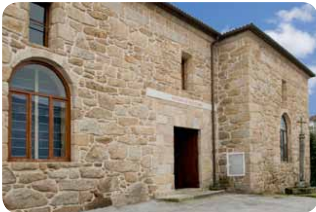
ENTRADA Á SALA DE ESCULTURA DO MUSEO ARQUEOLÓXICO PROVINCIAL SITUADA AO LADO DO CLAUSTRO DE SAN FRANCISCO