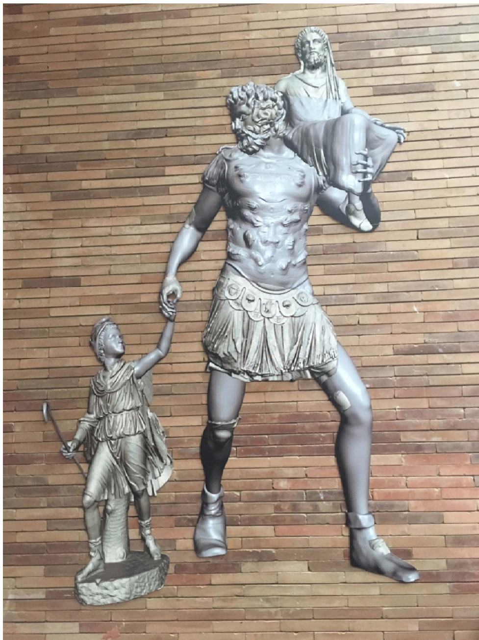
Recreación 3D del Grupo de Eneas. Grupo de Investigación de la UNEX-MNAR.

SUBDIRECCIÓN GENERAL DE MUSEOS ESTATALES