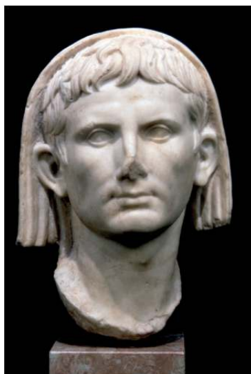
Cabeza velada de Augusto divinizado del Teatro Romano de Mérida.

En la sala V se ofrece un viaje por la religión oficial romana. Los dioses romanos, herederos de los griegos, componían una armónica familia celestial a la que se unían otros seres, los héroes y semidioses. Cada uno de ellos era objeto de un relato, el Mito, que explicaba su origen y acciones. A Júpiter y Juno, padres de los dioses, se unió Minerva, componiendo la Tríada Capitolina. Venus y Marte, Mercurio y Baco, Plutón y Proserpina... Eran algunos de los más venerados.