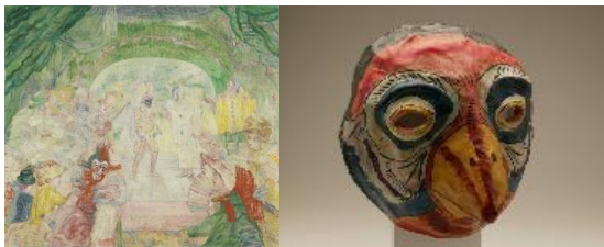
James Ensor Teatro de máscaras , 1908 (Theatre of Masks) Óleo sobre lienzo. 72 x 86 cm Museo Nacional Thyssen-Bornemisza Florentino Jiménez Máscara zoomorfa , 1991 (Zoomorphic mask) Papel y pintura. 18,3 x 17,2 x 11,3 cm Museo Nacional de Antropología, Madrid