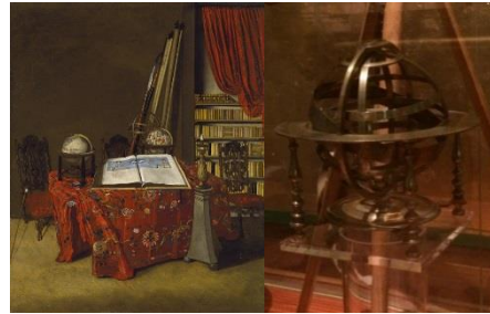
Jan Jansz. van der Heyden Rincón de una biblioteca , 1711 (Corner of a Library) Óleo sobre lienzo. 77 x 63 cm Museo Nacional Thyssen-Bornemisza Esfera armilar geocéntrica . Inglaterra, siglo XVII (Geocentric armillary sphere) Latón. 22 cm diámetro Museo Naval, Madrid