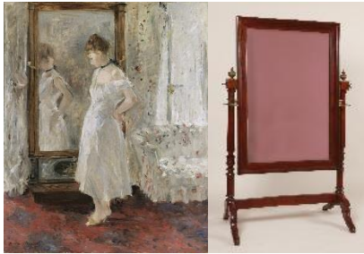
Berthe Morisot El espejo psíquico , 1876 (The Psyche Mirror) Óleo sobre lienzo. 65 x 54 cm Museo Nacional Thyssen-Bornemisza Espejo psíquico . Francia, 1826-1900 (Psyche Mirror) Madera de caoba, cristal, bronce y latón 174 x 113 x 66 cm Museo del Romanticismo, Madrid