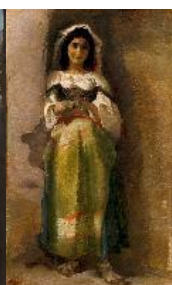
John Singer Sargent Vendedora veneciana de cebollas , hacia 1880-1882 (Venetian Onion Seller) Óleo sobre lienzo. 95 x 70 cm Museo Nacional Thyssen-Bornemisza Eduardo Rosales Ciociara , hacia 1862 Óleo sobre lienzo. 125 x 75 cm Museo Nacional del Prado, Madrid