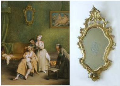
Pietro Longhi Las cosquillas , hacia 1755. Óleo sobre lienzo. 61 x 48 cm (The Tickle) Museo Nacional Thyssen-Bornemisza Espejo (Mirror). Real Fábrica de Cristales de La Granja, hacia 1765. Madera dorada y vidrio. 106 x 64 cm Museo Nacional de Artes Decorativas, Madrid