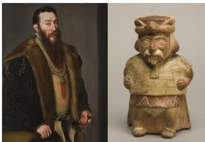
Antonio Moro Retrato de Giovanni Battista di Castaldo , hacia 1550 (Portrait of Giovanni Battista di Castaldo) Óleo sobre tabla. 107,6 x 82,2 cm Museo Nacional Thyssen-Bornemisza Vasija antropomórfica . Perú, 100 a.C.-700 (Anthropomorphic vessel) Cerámica. 19,5 x 11,5 cm. Museo de América, Madrid