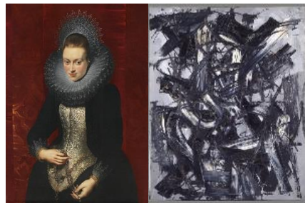
Peter Paul Rubens Retrato de joven dama con rosario , hacia 1609-1610 (Portrait of a Young Woman with a Rosary) Óleo sobre tabla. 107 x 76,7 cm Museo Nacional Thyssen-Bornemisza Antonio Saura Dama , 1958 (Lady) Óleo sobre lienzo. 162 x 130 cm Museo Nacional Centro de Arte Reina Sofía, Madrid