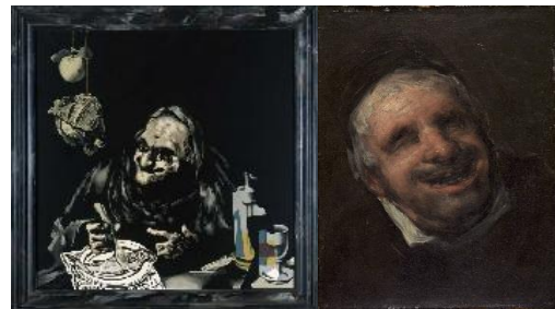
Francisco de Goya y Lucientes El tío Paquete , hacia 1819-1820 Óleo sobre lienzo. 39 x 31 cm Museo Nacional Thyssen-Bornemisza Equipo Crónica La comida , 1972 (The Meal) Acrílico sobre lienzo y sobre el marco 140 x 140 x 6,5 cm (con marco) Museo Nacional Centro de Arte Reina Sofía, Madrid