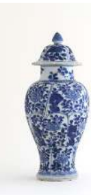
Balthasar van der Ast Vaso chino con flores, conchas e insectos , 1628 (Chinese Vase with Flowers, Shells and Insects) Óleo sobre tabla. 51,6 x 33,1 cm Museo Nacional Thyssen-Bornemisza Jarrón de la dinastía Qing . China, hacia 1690 (Qing dynasty vase) Porcelana. 24 x 10 cm Museo Nacional de Artes Decorativas, Madrid