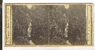
Gustave Courbet El arroyo Brème , 1866 (The Water Stream, La Brème) Óleo sobre lienzo. 114 x 89 cm Museo Nacional Thyssen-Bornemisza Adolphe Braun Oberland bernés. Catarata de Giessbach , hacia 1870 (Bernese Oberland. Giessbach Falls) Plata/albúmina sobre papel y cartón. 86 x 174 mm Museo del Romanticismo, Madrid