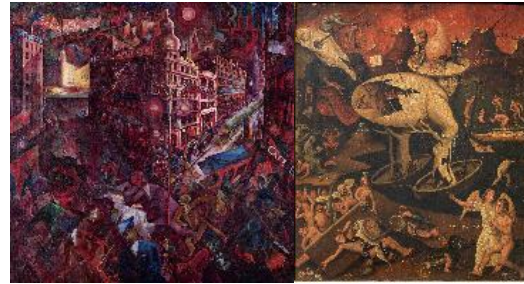
George Grosz Metrópolis , 1916-1917 Óleo sobre lienzo. 100 x 102 cm Museo Nacional Thyssen-Bornemisza Copia de El Bosco Fantasia moral (Visio tondali) , s. XV (Moral Fantasy (Visio Tondali)) Óleo sobre tabla. 29 x 24 cm Museo Nacional del Prado, Madrid