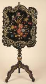
François Boucher La toilette , 1742 Óleo sobre lienzo. 52,5 x 66,5 cm Museo Nacional Thyssen-Bornemisza Pantalla de chimenea , hacia 1850-1900. (Fire screen) Madera, papel, pigmento y madreperla 108 x 91 x 70 cm Museo del Romanticismo, Madrid