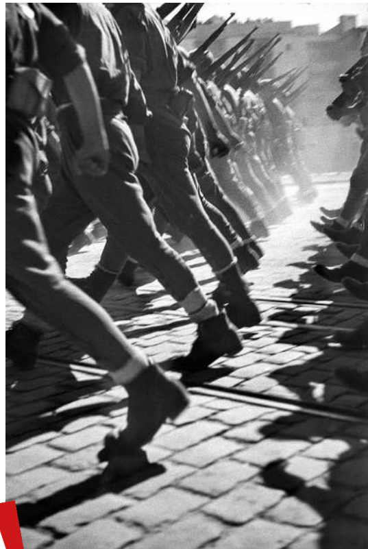
Sin título [Tropas italianas en el “Desfile de la Victoria” franquista], Barcelona, 21 de febrero de 1939. Archivo Campaña